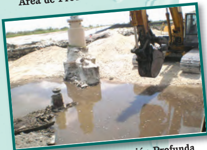
Area del Pozo de Inyección Profunda