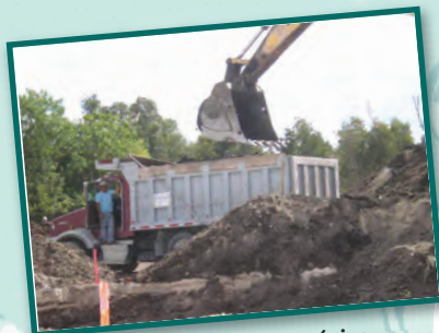
Remoción de Material Orgánico