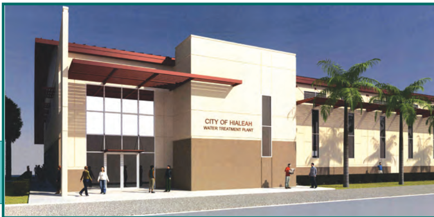
Vista de la entrada principal