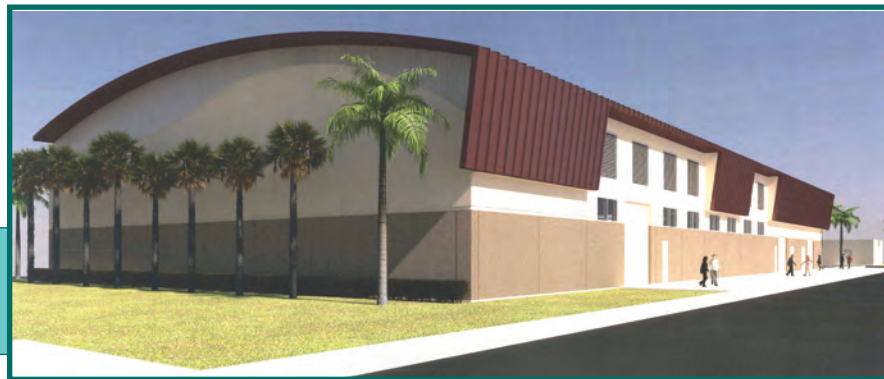
Vista del costado suroeste