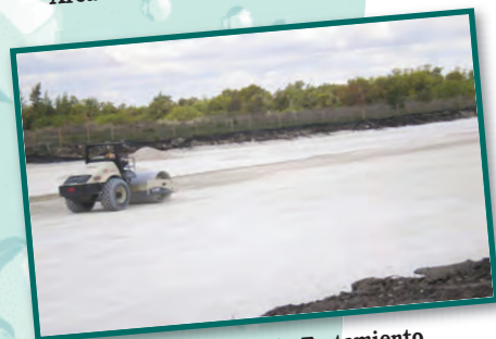
Relleno de la Planta de Tratamiento

El Departamento de Agua y Alcantarillado de la Ciudad de Hialeah se complace en ofrecerle nuestro Reporte Anual Sobre la Calidad del Agua. Tanto la Ley de Seguridad del Agua Potable como las regulaciones del Estado de la Florida requieren la publicación anual del mismo. El reporte aporta información muy importante sobre la calidad del agua que abastecemos y provee números telefónicos y contactos necesarios que están a su disposición.