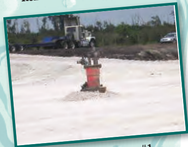
Area de Producción Pozo #1