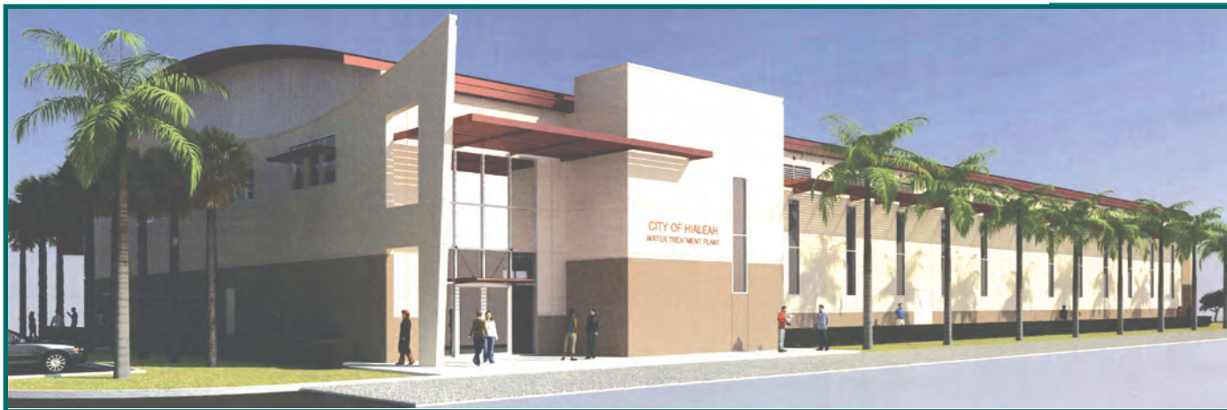
Vista del Costado Norte