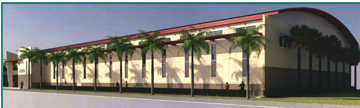
Vista del costado noroeste